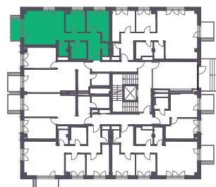
1. POSCHODIE 1ST FLOOR